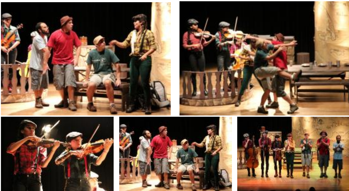
APRESENTAÇÃO DO ESPETÁCULO NO CENTRO CULTURAL WHURT EM COTIA / 2013