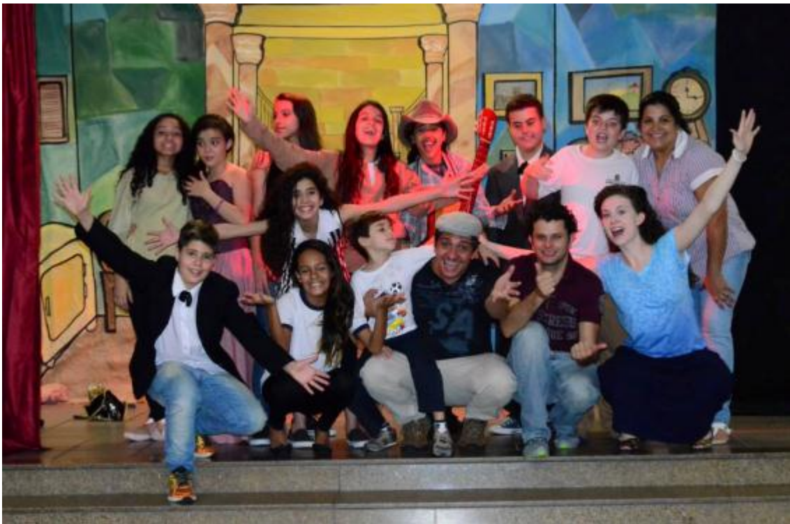
Apresentação da montagem inspirada no livro "O Fantasma da Máscara" pelos alunos da escola

Projeto realizado na Escola Municipal Marcílio Dias - Novembro de 2014