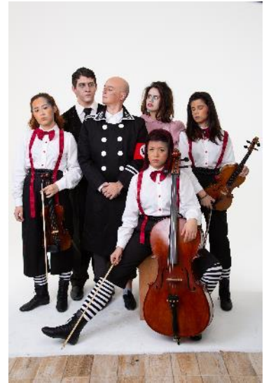
Ensaio fotográfico Espetáculo Guardado em Silêncio