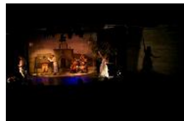
TEATRO MUBE – SETEMBRO 2014