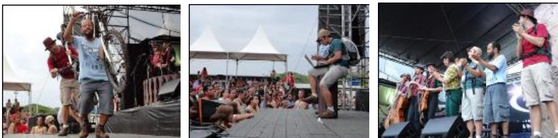
APRESENTAÇÃO DO ESPETÁCULO NO EVENTO DE CARNAVAL DA IGREJA BOLA DE NEVE EM SANTOS