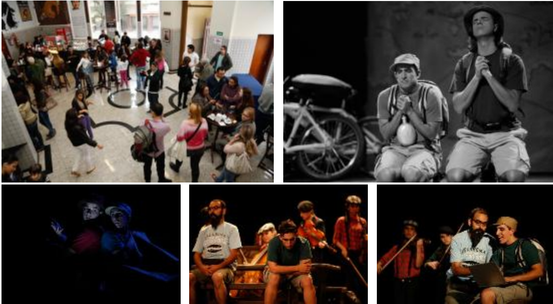
APRESENTAÇÃO NO TEATRO GRANDE OTELO EM SÃO PAULO / 2012