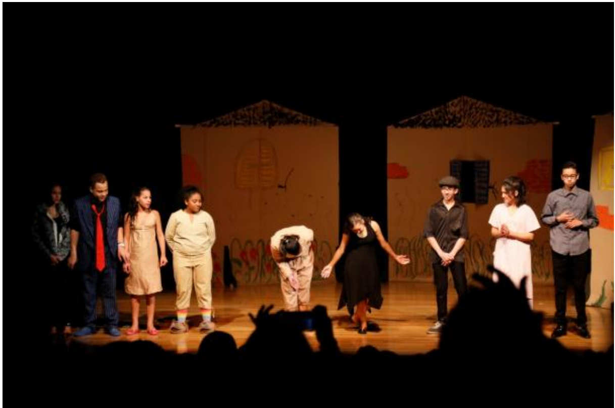
Apresentação da montagem histórias da Vila, escrita e interpretada pelos alunos da escola.

Projeto realizado na Escola Municipal Castro Alves - Agosto de 2016